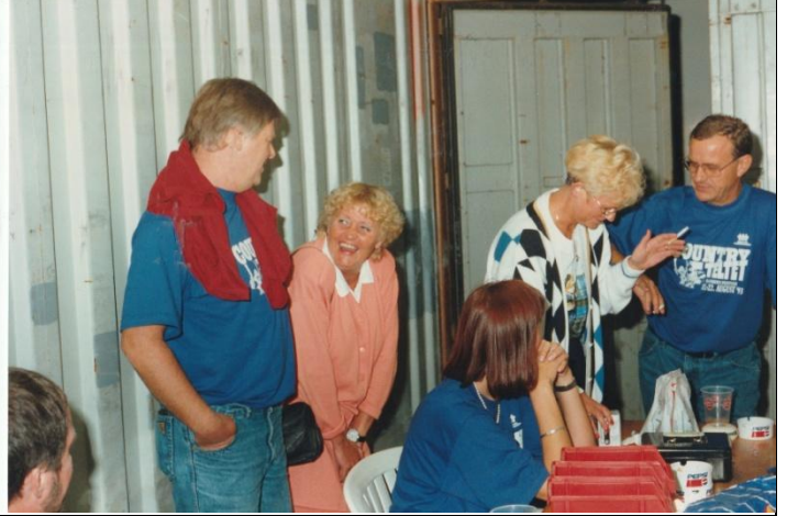
Rocky Tops spiller i Countryteltet