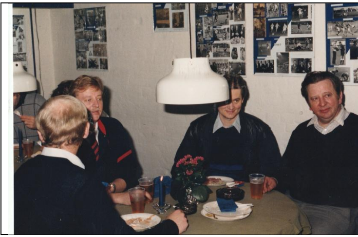
Første telt 1992